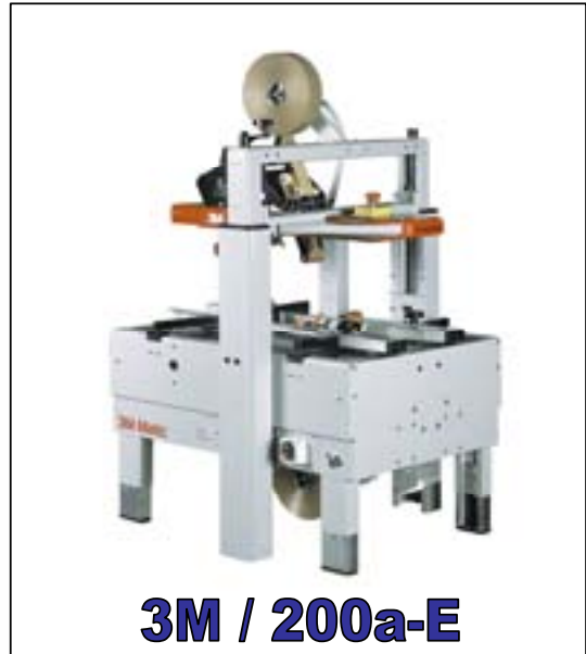
3M / 200a-E