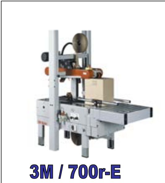
3M / 700r-E

Kostengünstig verpacken mit 3M-Matic Verschließmaschinen. schon ab einer Menge von 50 Kartons am Tag kann sich eine Verpackungsmaschine lohnen !! Lassen Sie sich unverbindlich von uns, vor Ort oder in unserem Hause beraten.