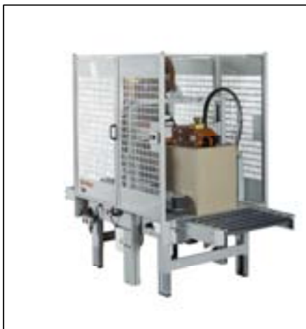
3M / 800r-E

3 kurzfristige Amortisierung der Anschaffungskosten